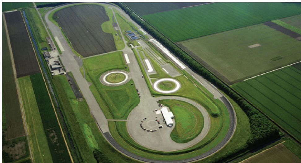
Luchtfoto RDW Test Centrum Lelystad